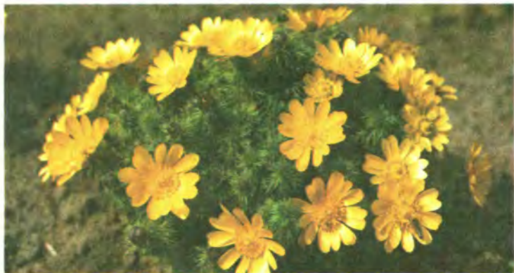
22. Горицвіт весняний.